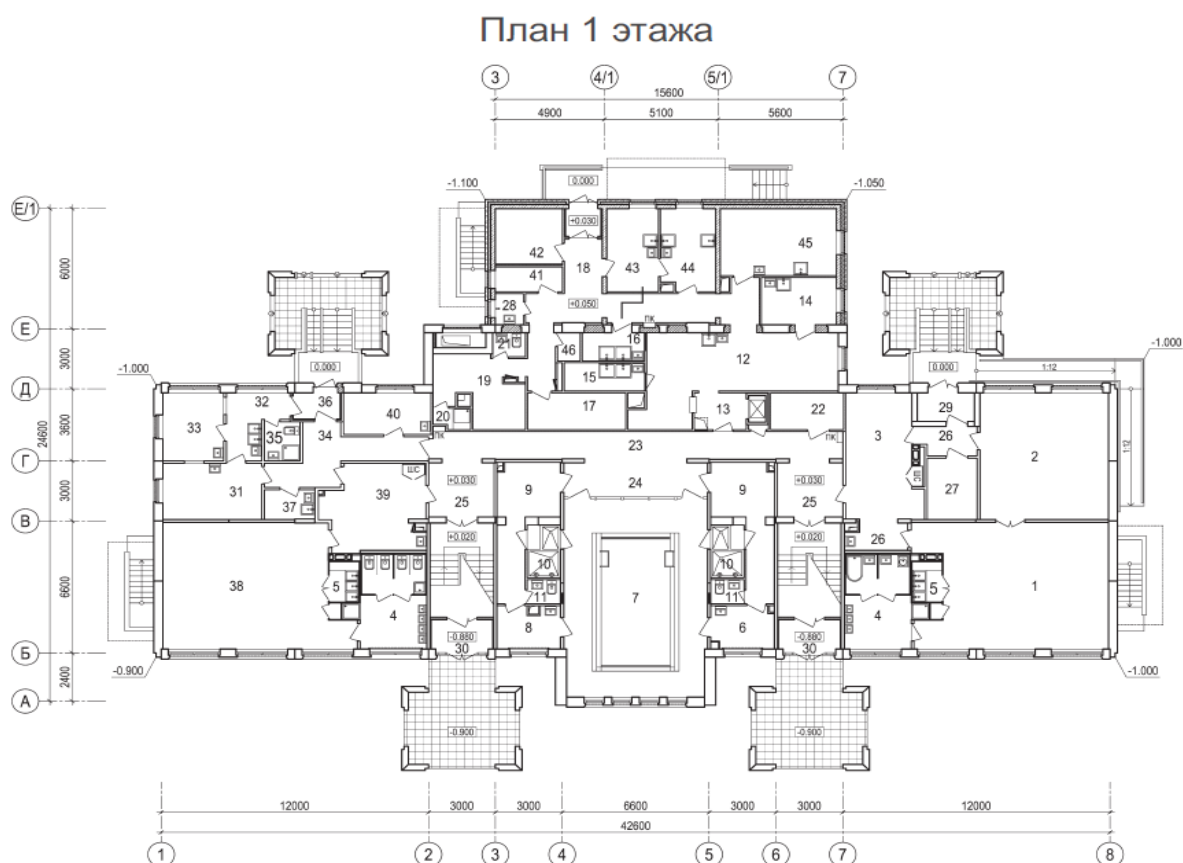
Рисунок 1. Вариант задания на курсовую работу - план первого этажа здания, для которого требуется составить проектно-сметную документацию